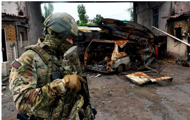
Фото: російський військовий (Gettyimages)

Російські медіаресурси продовжують систематично спотворювати реальну картину бойових дій, використовуючи Харківський напрямок для тиражування неправдивих успіхів.