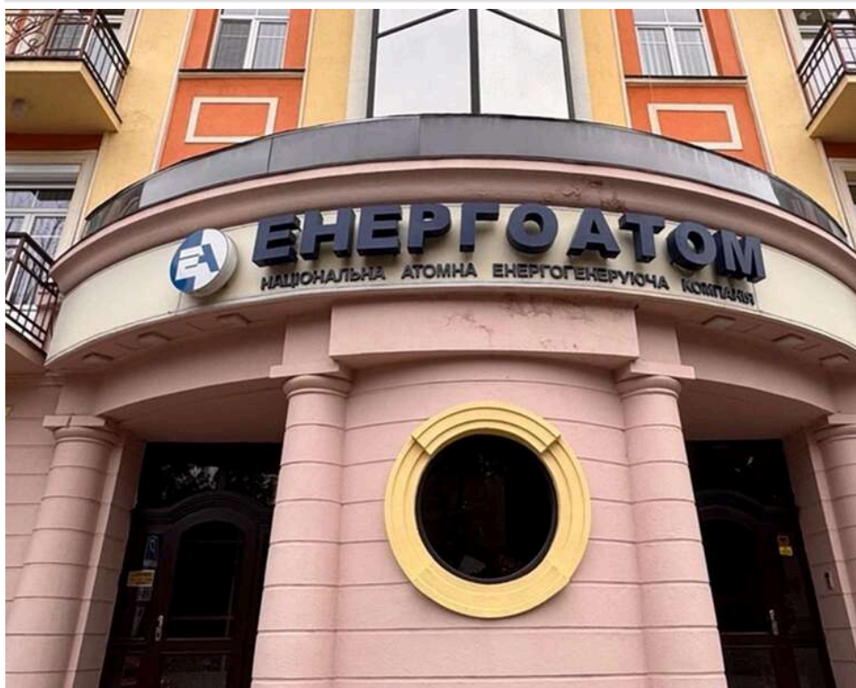
Комплаєнс із російським слідом та ціною в 2,3 мільйона: хто намагається очолити систему контролю в "Енергоатомі"

На сучасному етапі корпоратизації АТ "НАЕК "Енергоатом" ключовим завданням є побудова ефективної та незалежної системи внутрішнього контролю. Наразі триває відкритий добір кандидатів на посади керівників спеціальних підрозділів Наглядової ради, зокрема з питань аудиту, комплаєнсу та управління ризиками.