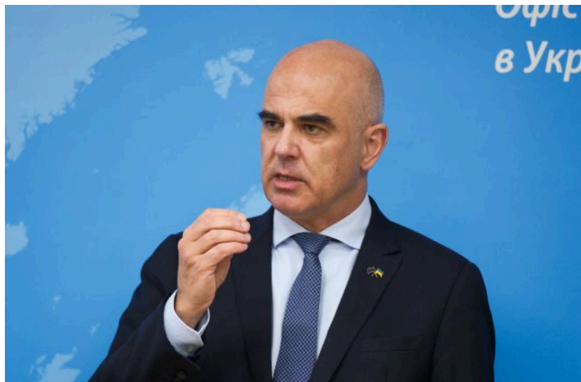
Фото: генеральний секретар Ради Європи Ален Берсе (Віталій Носач, РБК-Україна)