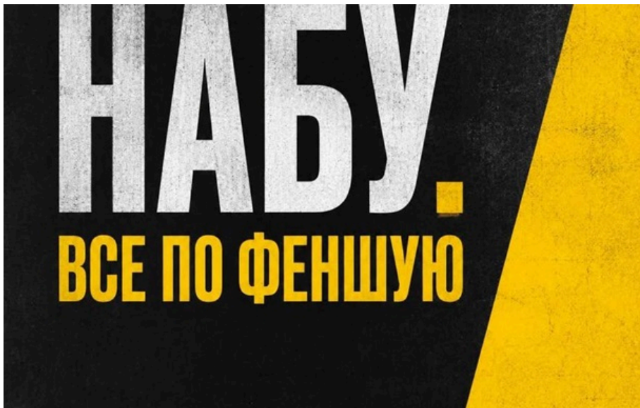
Меми та жарти про "гадалку Єрмака"

"Вероніка Феншуй" давала рекомендації главі Офісу президента щодо кандидатів на топ-посади в уряді.