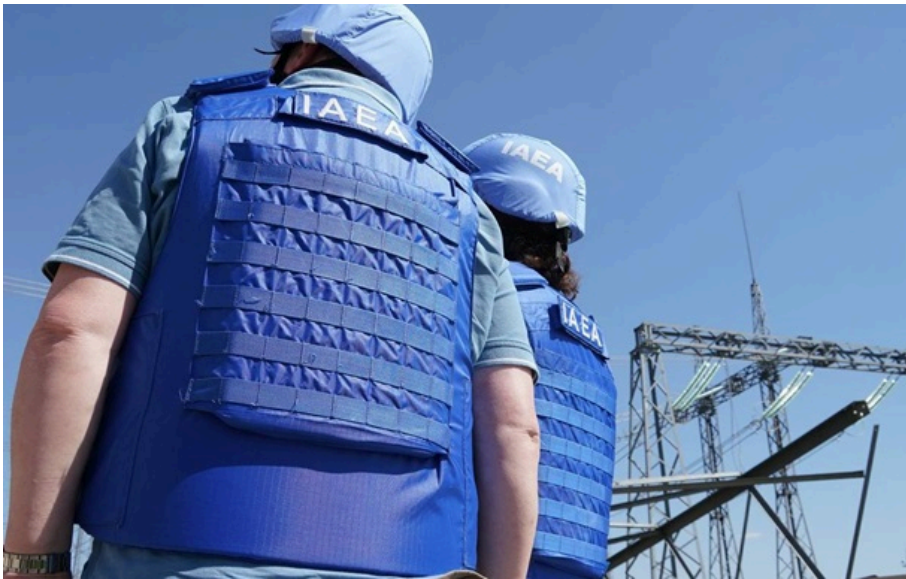
Експерти МАГАТЕ оглядають енергетичний об'єкт в Україні