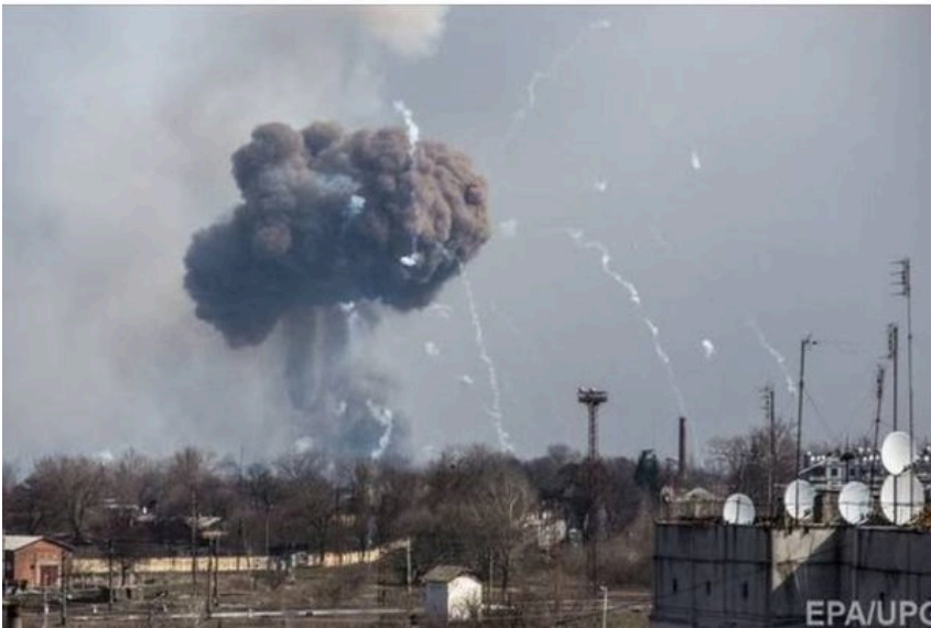
Пост Васильченкова