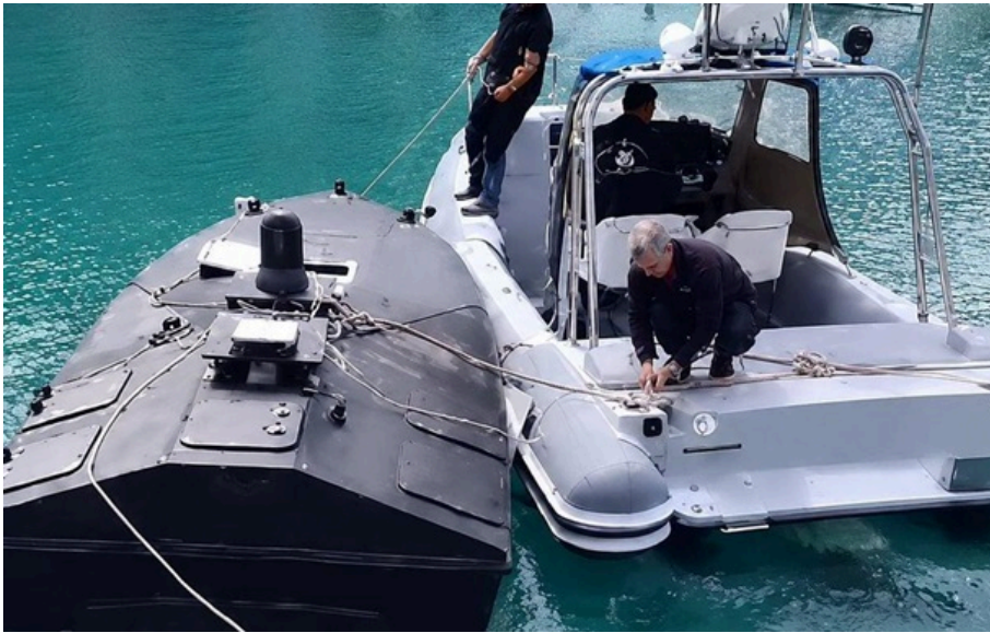
Греція "має право на чітке пояснення", переконаний голова Міноборони країни