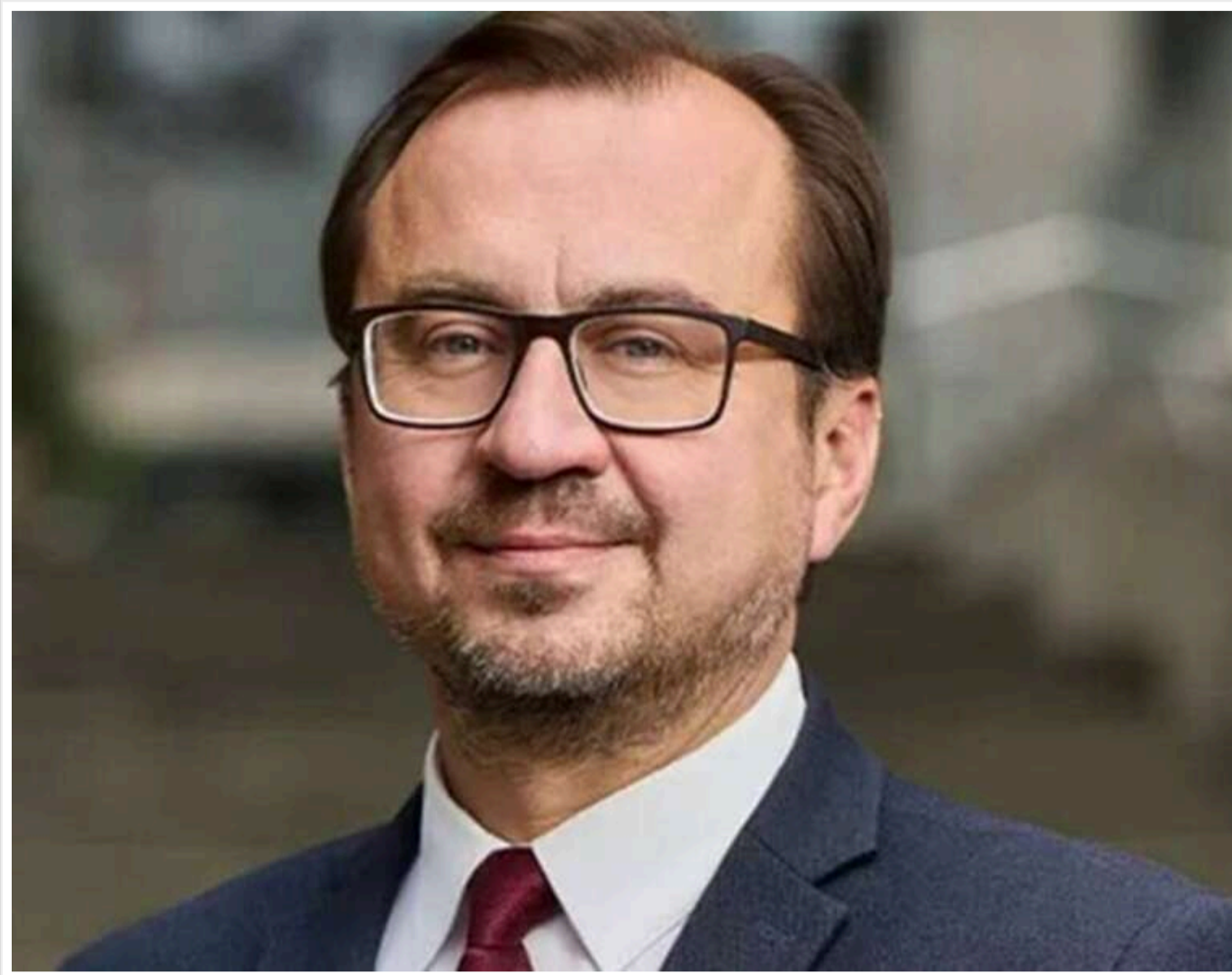
«Тіньова карта» куратора: Член наглядової ради Sense банку використовує чеську фірму для розрахунків з керівництвом НБУ