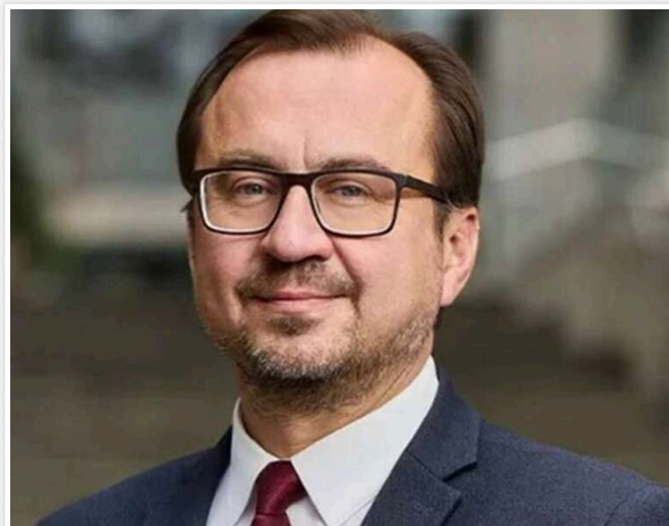
«Тіньова карта» куратора: Член наглядової ради Sense банку використовує чеську фірму для розрахунків з керівництвом НБУ