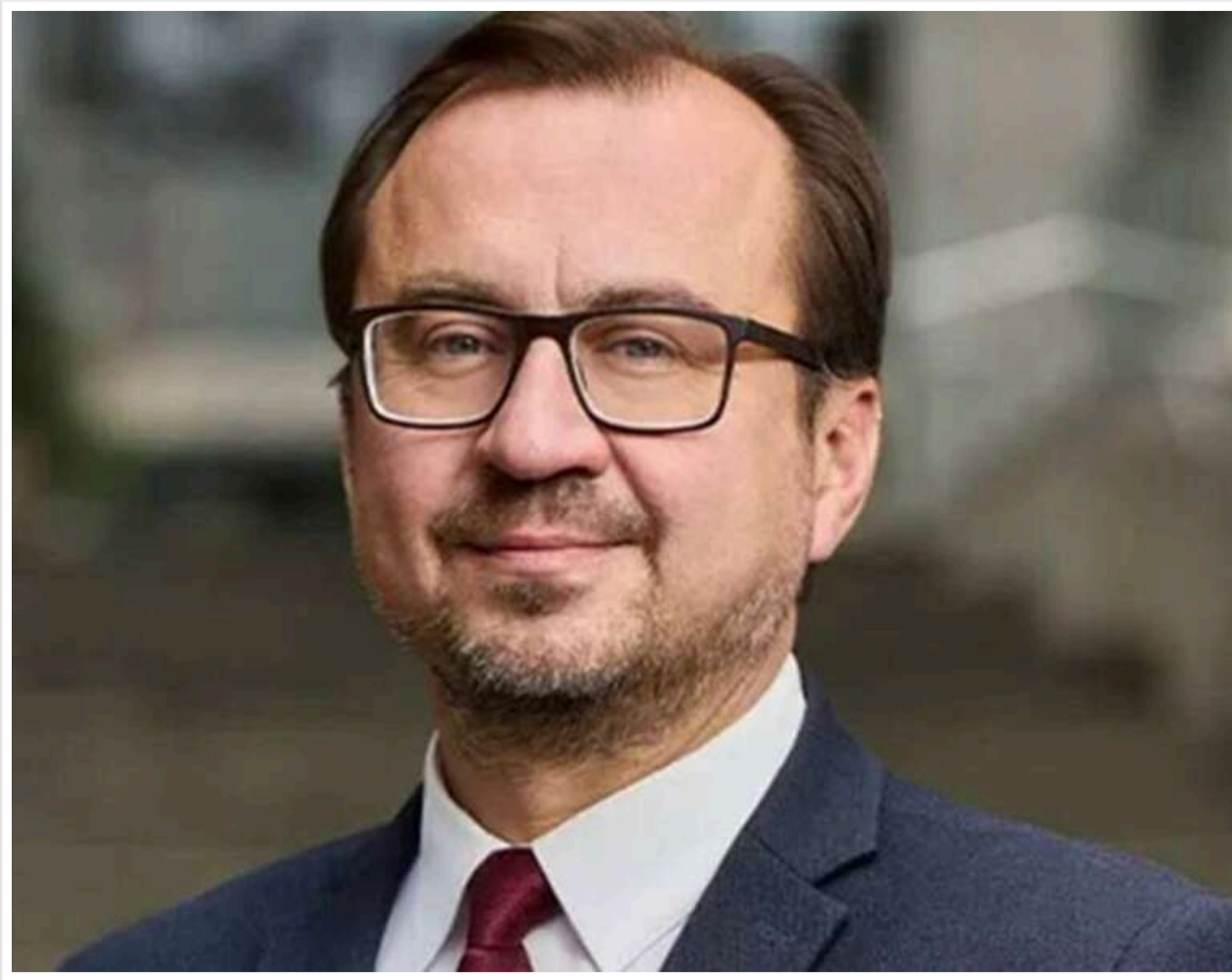
«Тіньова карта» куратора: Член наглядової ради Sense банку використовує чеську фірму для розрахунків з керівництвом НБУ