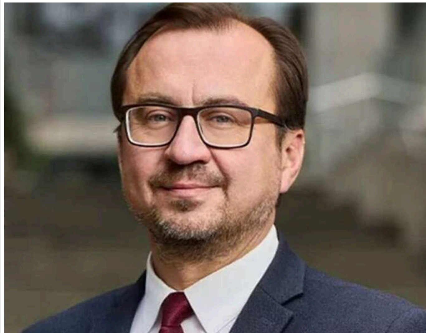
«Тіньова карта» куратора: Член наглядової ради Sense банку використовує чеську фірму для розрахунків з керівництвом НБУ