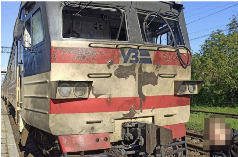
Фото: наслідки атаки на приміський поїзд