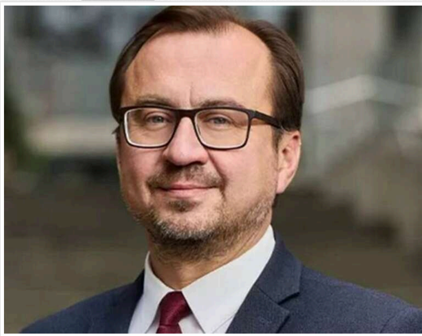
«Тіньова карта» куратора: Член наглядової ради Sense банку використовує чеську фірму для розрахунків з керівництвом НБУ

Читати на руськом Додати як бажане джерело в Google