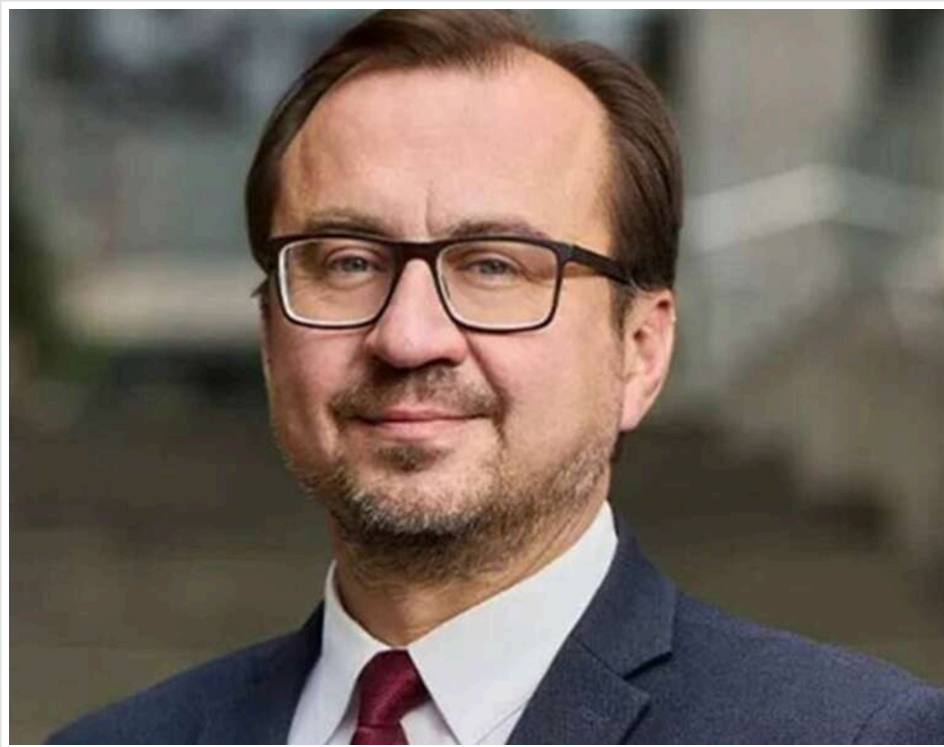
«Тіньова карта» куратора: Член наглядової ради Sense банку використовує чеську фірму для розрахунків з керівництвом НБУ