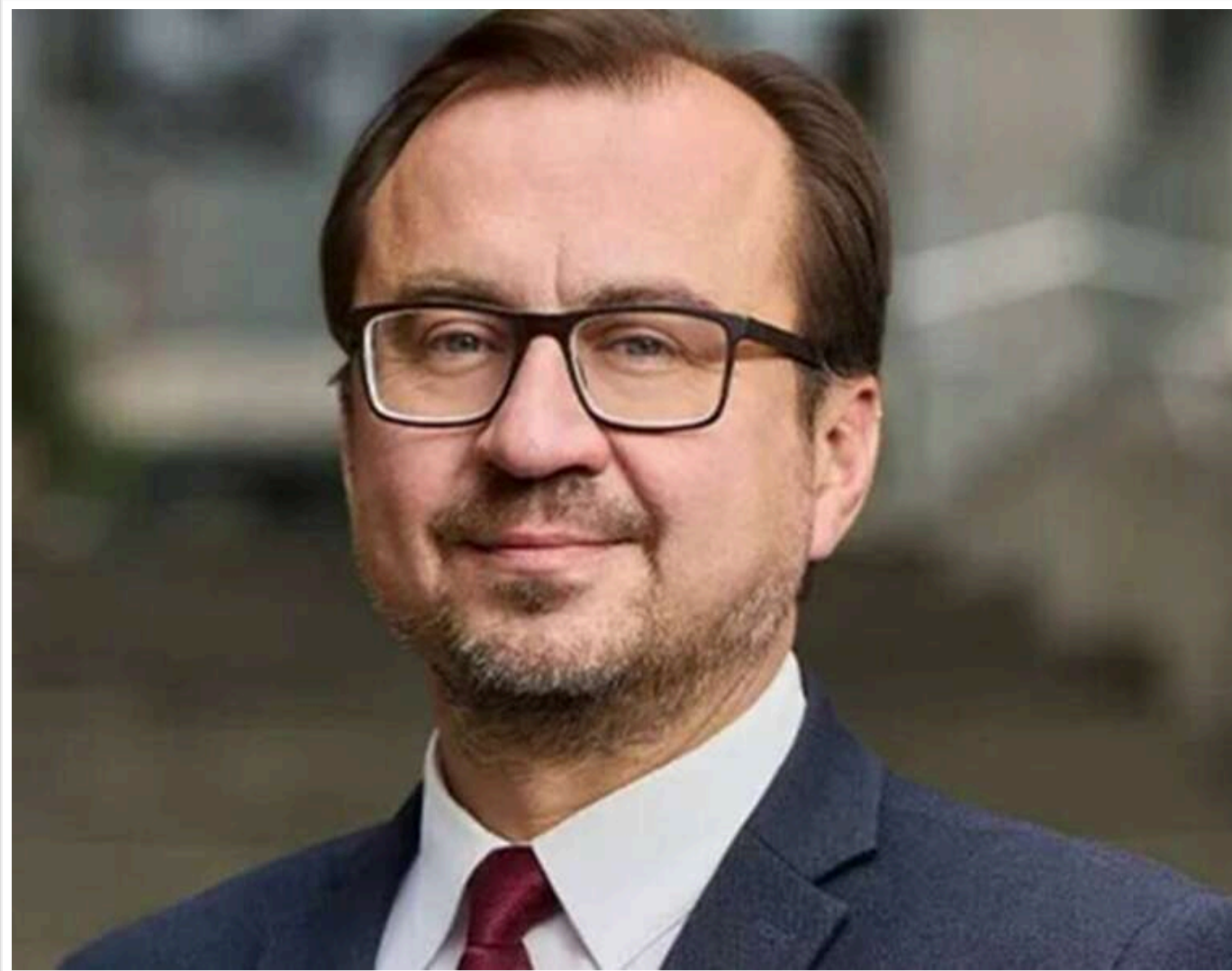
«Тіньова карта» куратора: Член наглядової ради Sense банку використовує чеську фірму для розрахунків з керівництвом НБУ