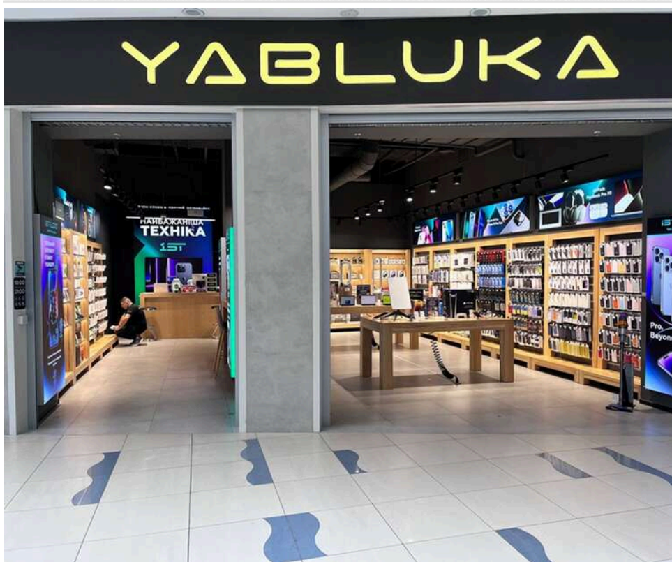
Суд не повірив у «процедурні порушення»: магазин YABLUKA заплатить 1,5 мільйона гривень за відсутність обліку