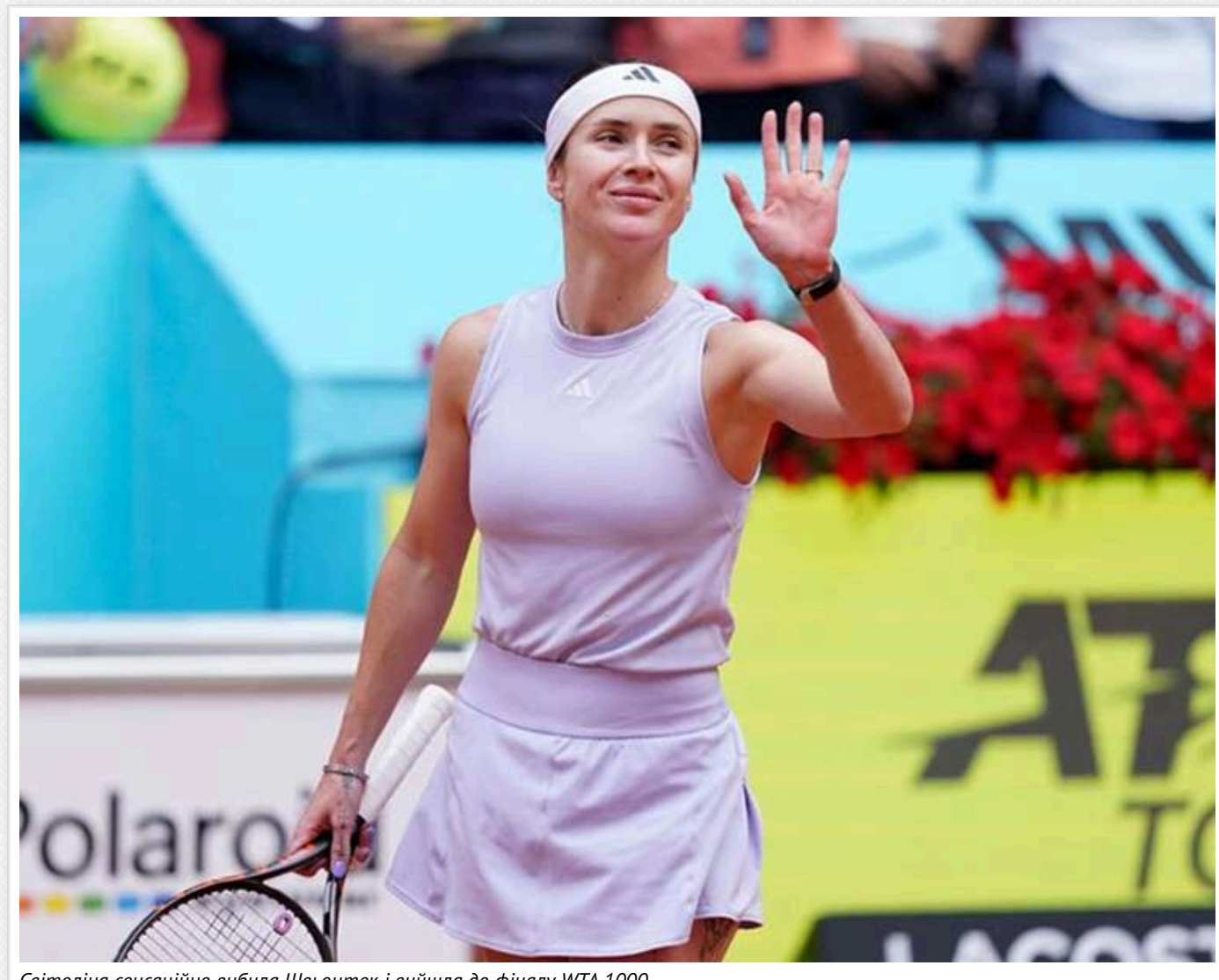
Світлоліна сенсаційно вибила Швьонтек і вийшла до фіналу WTA 1000

Найкраща тенісистка України Еліна Світлоліна (№10 WTA) сенсаційно здолала третю ракетку світу Ігу Швьонтек із Польщі в півфіналі турніру WTA 1000 у Римі з призовим фондом 7 228 080 євро.