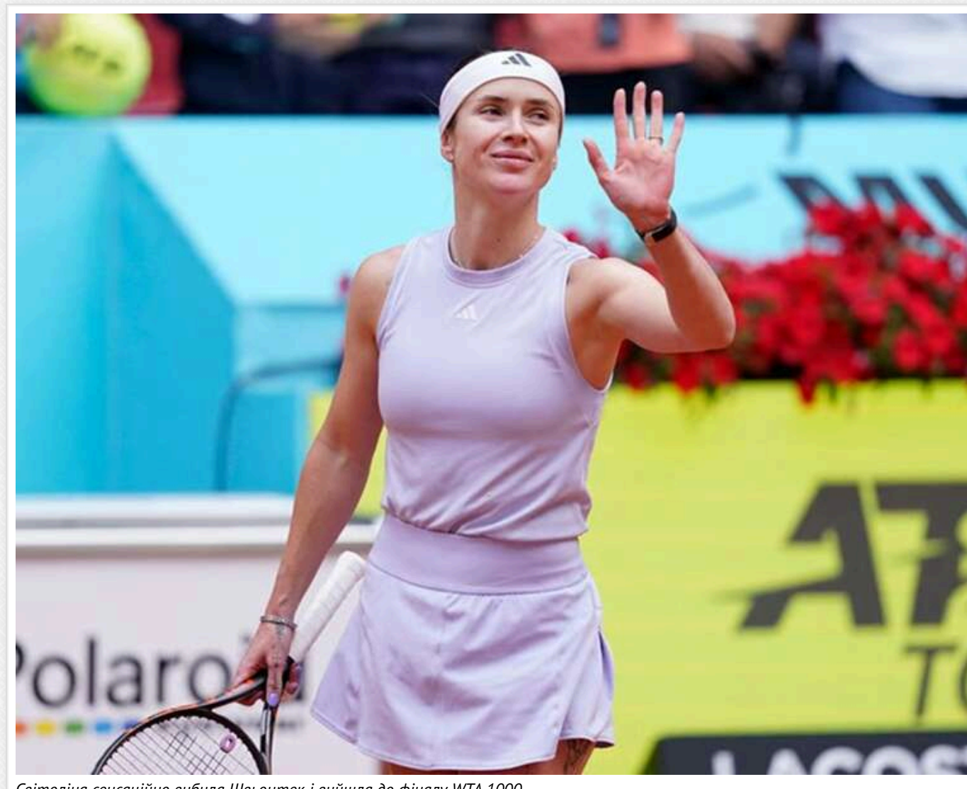
Світлоліна сенсаційно вибила Швьонтек і вийшла до фіналу WTA 1000

Найкраща тенісистка України Еліна Світлоліна (№10 WTA) сенсаційно здолала третю ракетку світу Ігу Швьонтек із Польщі в півфіналі турніру WTA 1000 у Римі з призовим фондом 7 228 080 євро.