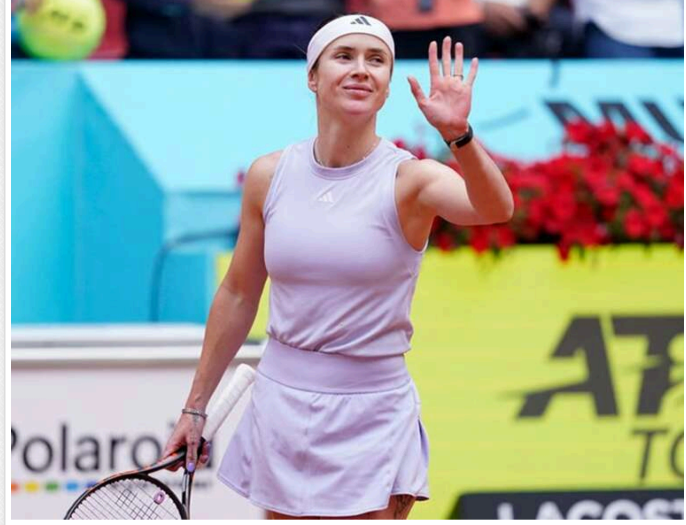
Світліна сенсаційно вибила Швонтек і вийшла до фіналу WTA 1000

Найкраща тенісистка України Еліна Світліна (№10 WTA) сенсаційно здолала третю ракетку світу Ігу Швонтек із Польщі в півфіналі турніру WTA 1000 у Римі з призвом фондом 7 228 080 євро.