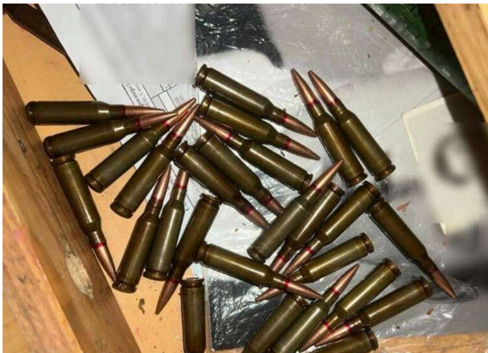
У Львові засудили чоловіка за спробу переслати зі США частини зброї та сотні патронів