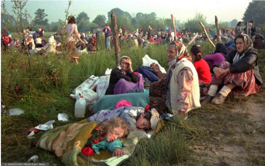
Біженці із Сребрениці, які провели ніч просто неба, збираються біля бази ООН в аеропорту Тузли, 14 липня 1995 року.

Європа та США визнали незалежність нових держав, з іншого — на всіх скопом наклали ембарго на закупівлю зброї за кордоном, розраховуючи в такий спосіб наблизити кінець бойових дій. По Боснії це рішення вдарило найсильніше. У республіці був великих запасів озброєнь і бойової техніки, серйозні виробничих потужності їхнього виробництва також були відсутні. А у Сербії все це було. І значної частини зброї вирушала Белградом навіть своєї армії, а загонам боснійських сербів, котрі воювали проти незалежної Боснії.