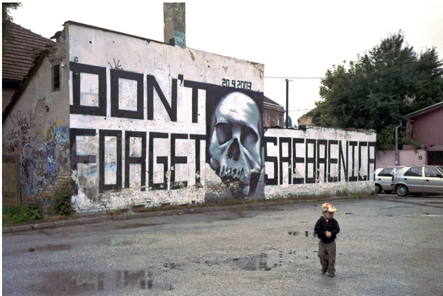
Графіті «Не забувай Сребреницю», присвячене десяти роковинам різанини в Сребрениці в Сараєво.