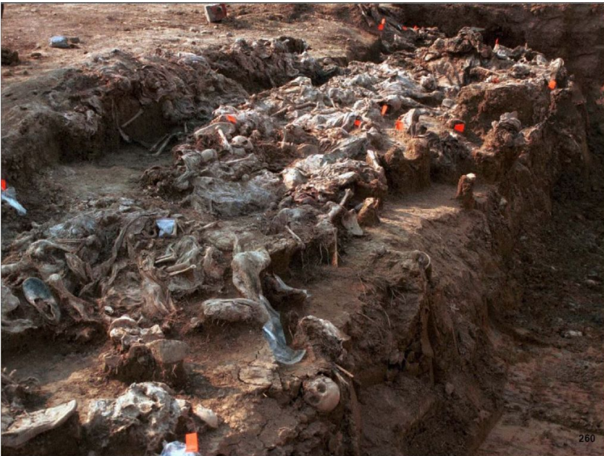
Ексгумація жертв різанини у Сребрениці.

Більшості перед стратою зв'язали руки та ноги, багатьох перед смертю катували. Тіла загиблих поховали у кількох величезних братських могилах, поспіхом викопаних на околицях міста. Це був найбільший і найкривавіший військовий злочин у Європі з часів Другої світової та до облоги Маріуполя після початку повномасштабного вторгнення Росії до України у 2022 році.