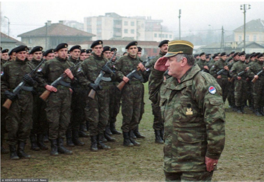
Командувач армією боснійських сербів генерал Ратко Младіч перевіряє війська у місті Власениця, 2 грудня 1995 року.

І відразу почав мститися. Чоловіків-боснійців обманом зібрани на міському футбольному полі та кількох інших відкритих майданчиках. Використовуючи захоплені ООНівські радіостанції, Младич зміг повернути до Сребрениці навіть тих, хто утік із міста та сховався у найближчому лісі. Людей переконали, що їхнім життям нічого не загрожує і що ООН просить усіх повернутися до міста. Жінок, старих та дітей відправили автобусами на територію, контрольовану боснійцями. Чоловікам, багато хто з яких насправді були ще підлітками 15-16 років, обіцяли, що їх поміняють на сербських полонених, і почали розвозити по різних точках, звідки потім їх нібито мали відправити на обмін. Але замість обміну загони Младіча влаштували масові розстріли. За кілька днів у Сребрениці було вбито близько 8 тисяч беззбройних людей.