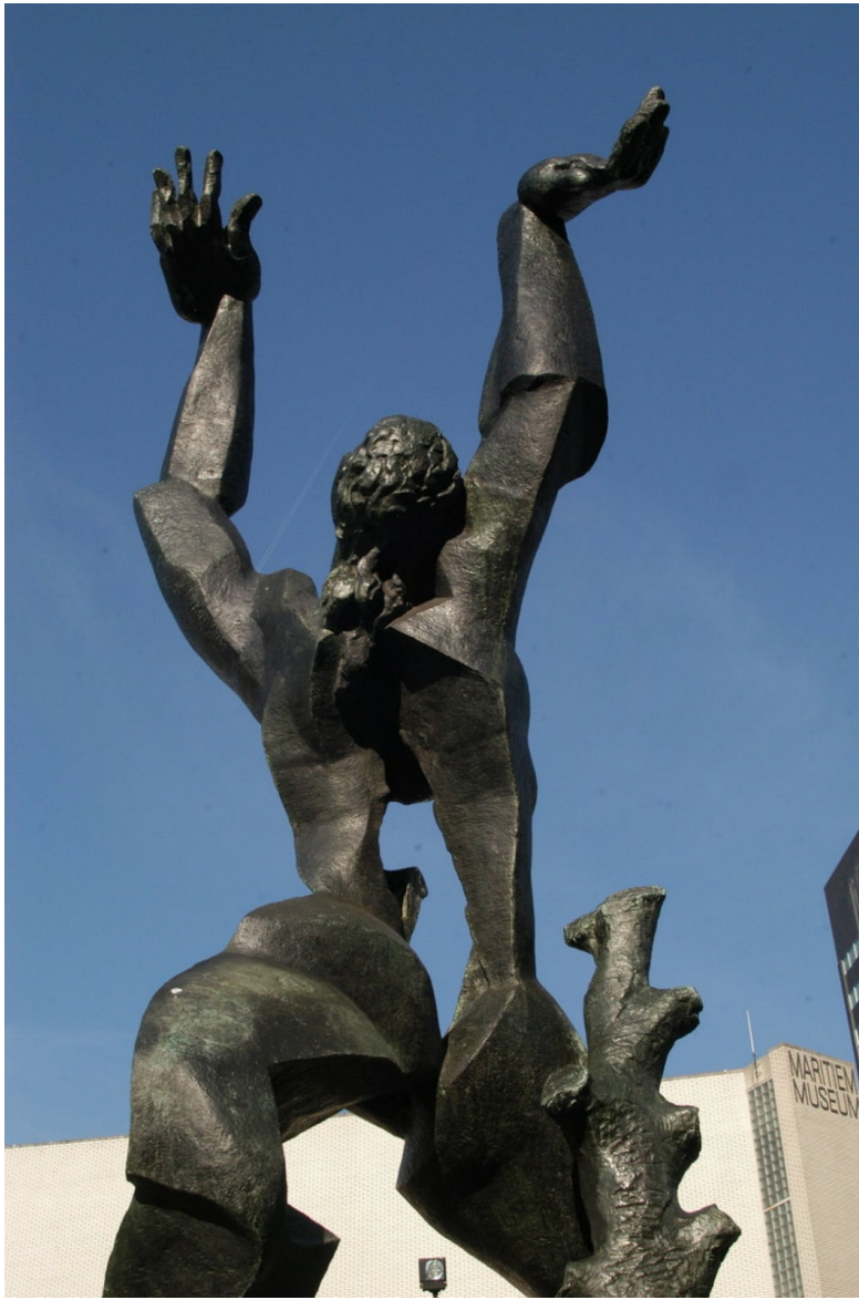
Скульптура «Зруйноване місто», або «Місто без серця» Осипа Цадкіна в Роттердамі, присвячена трагедії бомбардування в 1940 р., 1951-1953.