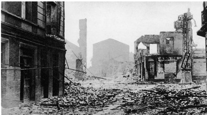
Руїни Герніки після бомбардування Люфтваффе.

Сталося це 26 квітня 1937 року під час громадянської війни в Іспанії. Герніку бомбардували впродовж 3 годин 3 ескадрильї легіону «Кондор». У Герніці було декілька військових об'єктів, але замість точкових ударів німці застосували «килимове» бомбардування. У місті навіть не було пожежної команди, а найближча знаходилась за 9 км – у Більбао. Тоді загинуло близько 800 людей.