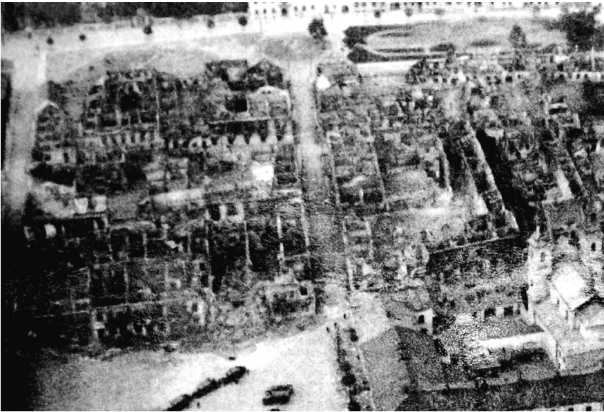
Велюнь, 1939.

З точки зору міжнародного права це було абсолютне порушення воєнних норм, зокрема тих, що стосуються гуманізму і пропорційної сили. Поляки двічі – в 1978 і 1983 роках – намагалися притягнути до відповідальності причетних до бомбардування шпиталю, але німецька сторона відхилила позови: мовляв, вранці був туман і нацистські пілоти «погано бачили».