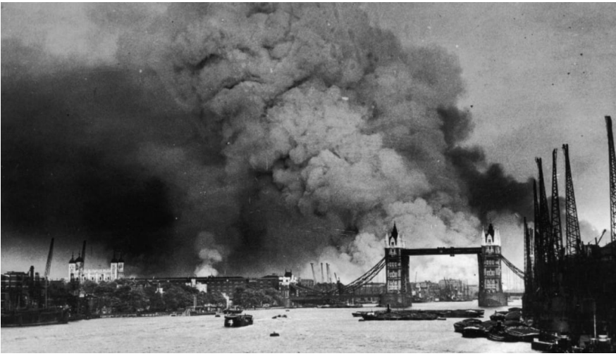
Бомбардування Лондона в 1940 р.

Крім Ковентрі, чимало англійських міст, зокрема й Лондон, піддавались масованим повітряним атакам Люфтваффе в 1940-1941 рр.