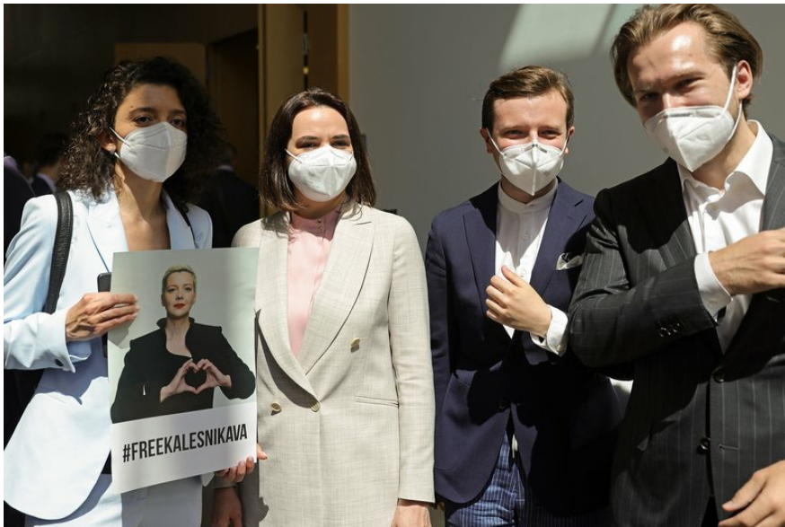
Лідерка білоруської опозиції у вигнанні Світлана Тихановська (друга зліва) з Тетяною Хоміч (ліворуч), Антоном Раднянковим (другий праворуч) та Іваном Кравцовим (праворуч) перед прес-конференцією у Берліні, Німеччина, 11 червня 2021 року.

Чого білоруси хочуть зараз? Тут парадоксальна ситуація: їм не подобається те, що пропонує опозиція — і те, що пропонує режим. Умовно кажучи, білоруси хочуть поваги, трохи кращої економіки — але без радикальних ліберальних реформ. Народ дотримується позиції, яку, на жаль, важко мати в сучасному світі — це мати добрі стосунки з усіма.