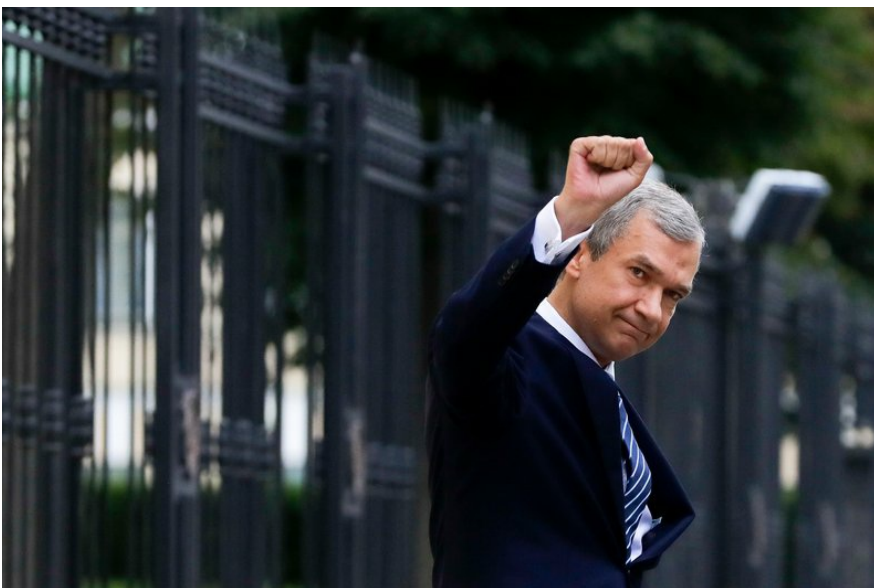
Павло Латушко, колишній міністр культури й посол Білорусі у Франції та прибічник протесту, вітає своїх прихильників та журналістів дорогою до Слідчого комітету Білорусі в Мінську 25 серпня 2020 року.

Так, у підсумку чимало людей пішли з системи — чиновники, навіть хтось із силового апарату. Але цього для падіння режиму виявилось замало.