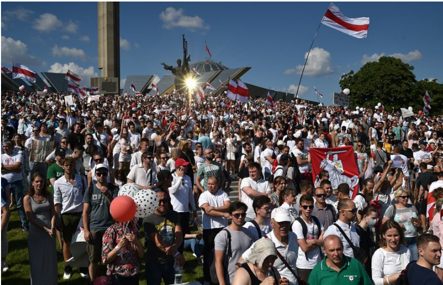
Мітинг у центрі Мінська 16 серпня 2020 року. Десятки тисяч прихильників білоруської опозиції вийшли на марш, протестуючи проти нечесних виборів і чергового переобрання президентом Лукашенка.