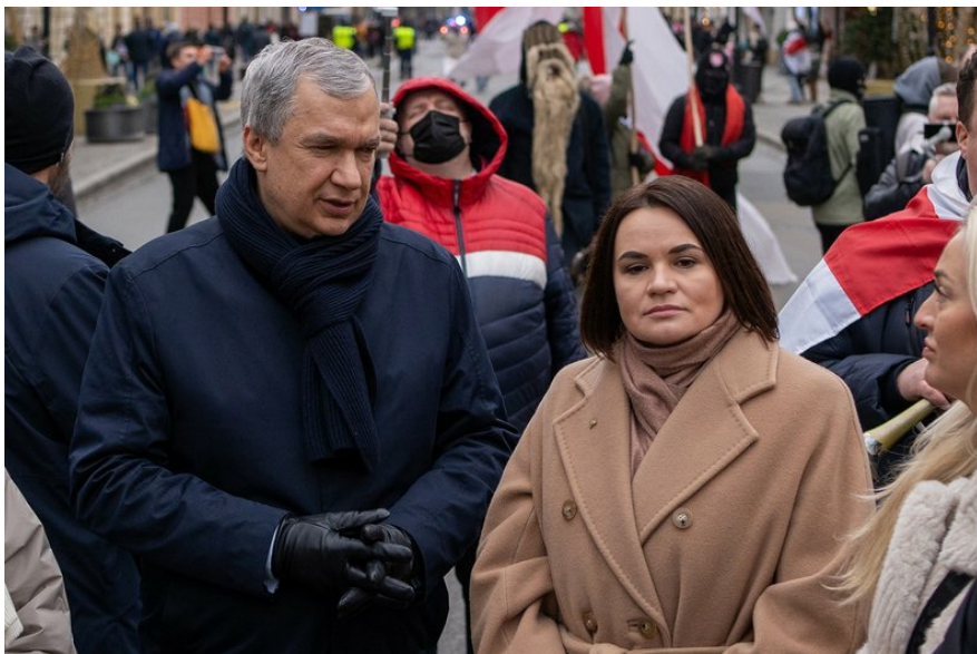
Павло Латушко (ліворуч) з лідеркою білоруської опозиції Світланою Тихановською у Варшаві 26 січня 2025 року. Громадяни Білорусі організували у столиці Польщі марш проти нечесних президентських виборів на батьківщині.

Ми намагаємось притягти Лукашенка до відповідальності перед міжнародним правосуддям за кількома напрямками. Передусім — за злочини проти людяності в Білорусі, які призвели до масового виїзду цивільних. Також — за незаконне вивезення українських дітей. Ми збрали докази, які доводять: Лукашенко як керівник так званої Союзної держави виділив гроші й організував вивезення не менше трьох із половиною тисяч дітей на територію Білорусі. Ми як організація підтримуємо створення спецтрибуналу за агресію проти України.