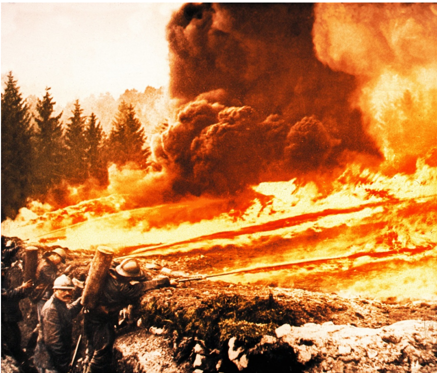
Застосування вогнеметів під час Верденської битви.

Потім сам потрапив під артилерійський обстріл. Також він став свідком виводу з передової американського полку. Згодом він згадуватиме про це в одній із публічних промов: «Я бачив війну. Я бачив війну на суші та на морі. Я бачив поранених, що стікали кров'ю. Я бачив людей, що вихаркували свої вражені газом легені. Я бачив трупи, що потонули в багнюці. Я бачив зруйновані міста. Я бачив дві сотні... знесилених солдатів, що відходили в тил, – рештки полку чисельністю в тисячу чоловік, які прийшли на фронт лише сорок вісім годин тому. Я бачив голодних дітей. Я бачив страждання матерів і вдів. Я ненавиджу війну».