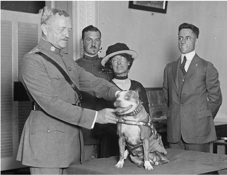
Генерал Джон Першинг нагороджує сержанта Стаббі медаллю на церемонії у Білому домі, 1921 р.

Птаха нагородили Військовим хрестом «За видатні заслуги». Нині його опудало виставлене в Смітсонівському музеї у Вашингтоні так само, як і сержанта Стаббі – бостонського тер'єра – найвідомішого собаки-воєнка Першої світової війни. Стаббі воював з американцями у Франції впродовж 18 місяців і брав участь у 100 боях. Був двічі поранений. Він єдиний собака, який отримав звання сержанта. Після його смерті The New York Times надрукувала некролог майже на шпальту, чого не кожен із видатних людей удостоювався.