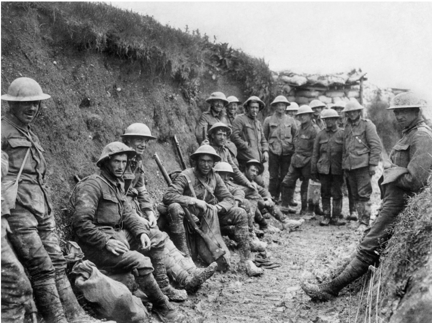
Окопна війна. Британські солдати Королівського ірландського стрілкового полку в траншеї на Соммі, осінь 1916.

Коли стало зрозуміло, що Британії доведеться проводити нову, фактично повторну мобілізацію, забираючи досвідчених робітників із виробництва (їх мали замінити жінки) – на фронті солдатів катастрофічно не вистачало – уряд, розуміючи, що потрібно хоч якось заспокоїти робітників, змушений був підняти податки на надприбутки підприємців і промисловців із 40%, як то було в 1915 році, до 80%.