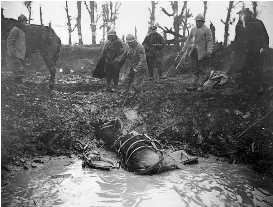
Мул лежить у вирві від снаряду на Західному фронті. Французькі солдати намагаються його витягти.

Грязюка була справжнім насланням Першої світової війни. У ній загинуло – втопилося, захлинулося чимало людей і тварин. Умови окопної війни по-своєму мали величезний деморалізуючий ефект. Ось як експресивно писала французька фронтова газета про грязюку, яка стала справжнісіньким прокляттям розгалуженої мережі траншей: