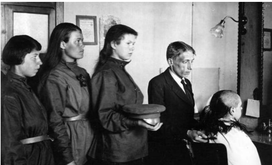
Жінки батальйону Бочкарьової у черзі на стрижку під нуль, 1917 р.

У Росії, з пропагандистською метою, на тлі тотального ухиляння чоловіків, у 1917 році було створено жіночий батальйон – так званий Жіночий батальйон смерті. Його очолила унтер-офіцер Марія Бочкарьова. Вона три роки воювала на Східному фронті, чотири рази була поранена і тричі нагороджена за хоробрість. У батальйоні воювало 300 жінок-добровольців.