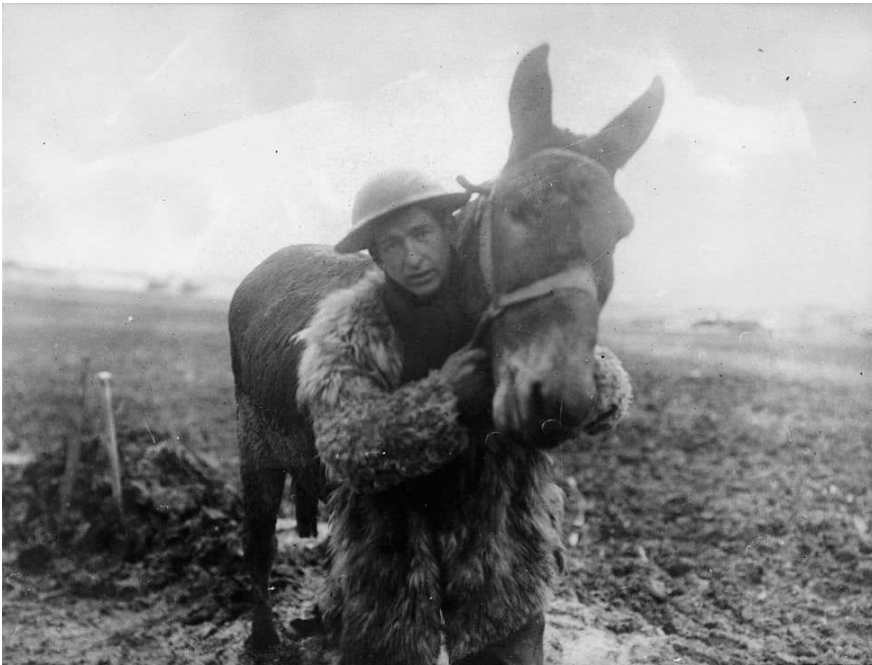
Солдат із мулом на Західному фронті, 1918р. Підпис під фото: «Вона хоча й дурепа, але я люблю її».