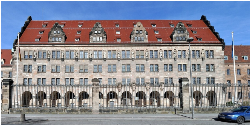
Палац юстиції, Нюрнберг; сучасний вигляд.

Місцем проведення МВТ було обрано Нюрнберг – місто, що стало символом нацизму. Тут Гітлер проголошував расові закони, тут відбувалися численні з'їзди націонал-соціалістичної партії Німеччини.