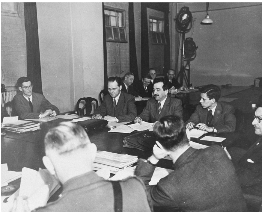
А. Трайнін виступає в Лондоні в серпні 1945 р. на засіданні Виконавчого комітету Нюрнберзького МВТ.