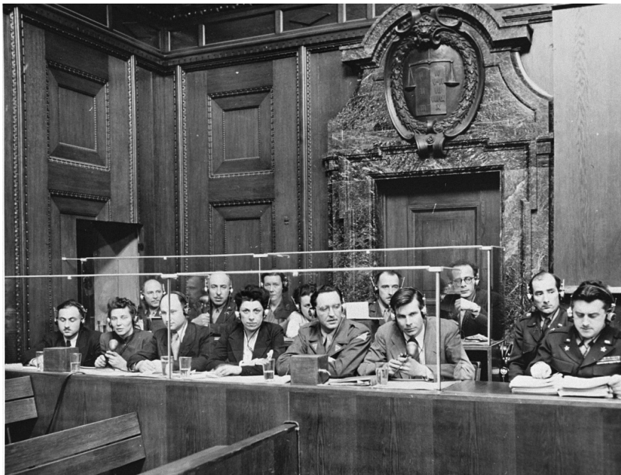
Перекладачі в залі суду. 29 березня, 1946 р.