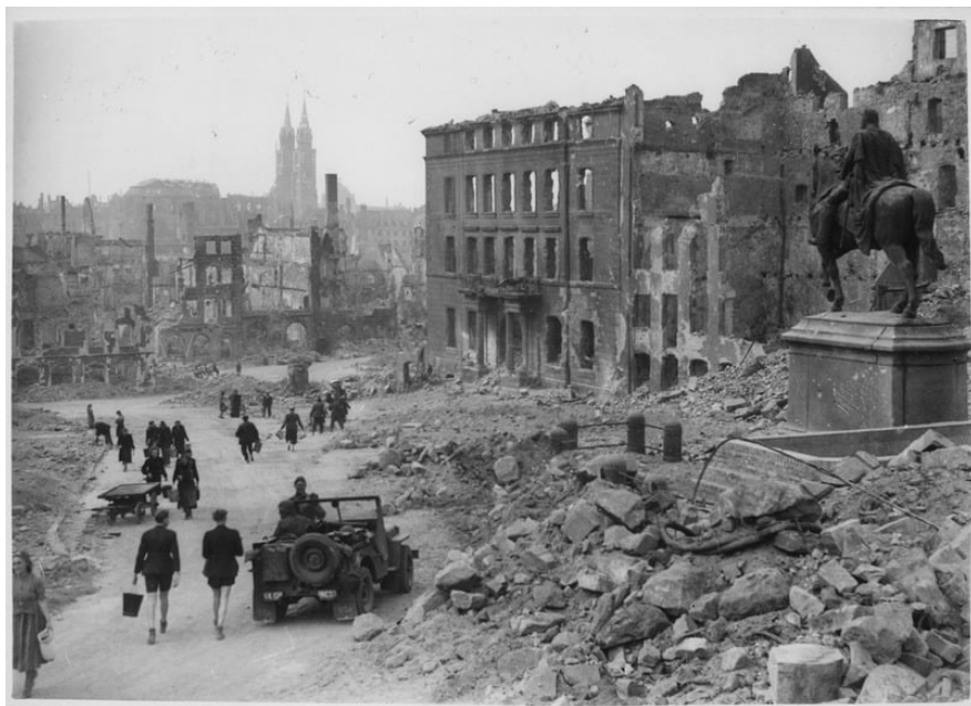
Руїни Нюрнбергу, 1945 р.

Жодна з делегацій держав-учасниць процесу не бажала чіпати скелетів у власних шафах, виносячи на широкий загальний політику своїх урядів, виставляючи її в невідомому світлі. Це стосувалося питань аншлюсу Австрії, мюнхенських англо-французьких «кульбітів», радянсько-німецьких таємних відносин, тобто пакту Молотова-Ріббентропа.