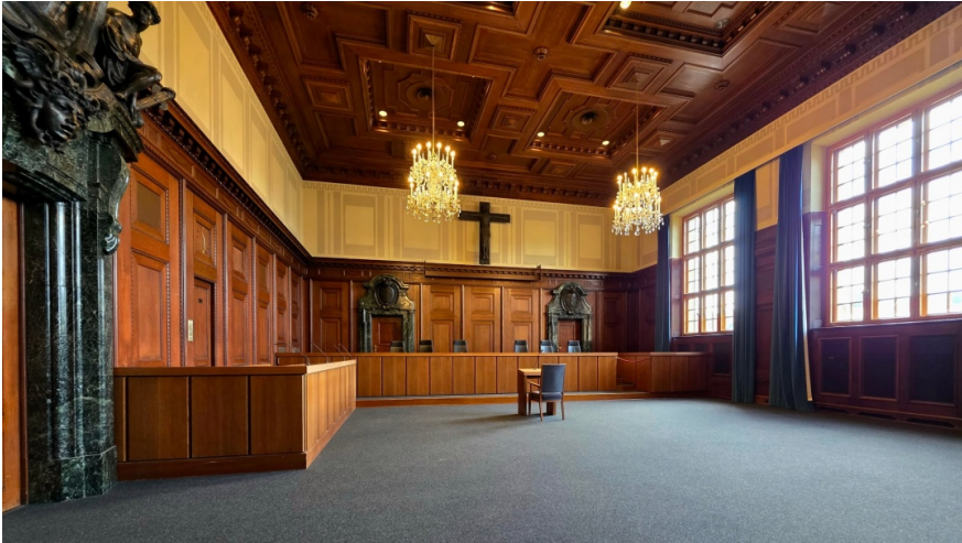
Зала суду (зала 600) Нюрнберзького МВТ, сучасний вигляд.

Читайте також: Що може отримати Україна від першого вироку Міжнародного суду ООН у відношенні путінської Росії