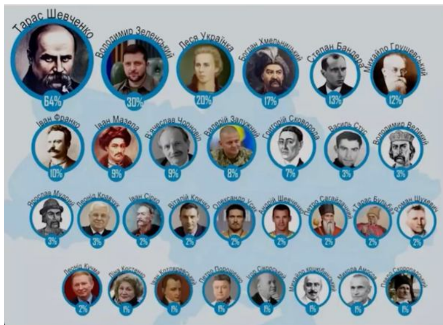
Скріншот з відео