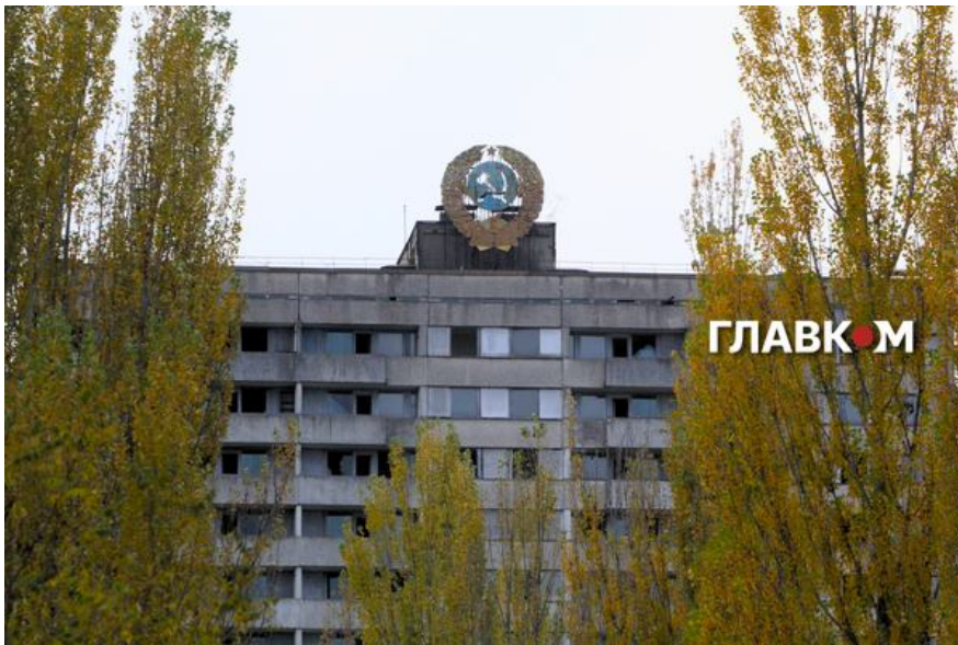
Чорнобильська катастрофа призвела до розпаду найбільшої у світі радянської імперії

Деядернізація світу набирала обертів, і Україна у цьому процесі стала лідером. Демократично обраний у 1990 році український парламент одним з перших рішень ухвалив постанову від 2 серпня 1990 року «Про мораторій на будівництво нових атомних електростанцій на території УРСР». Цією Постановою на п'ять років зупинялось будівництво нових АЕС та добудова атомних енергоблоків на діючих станціях.