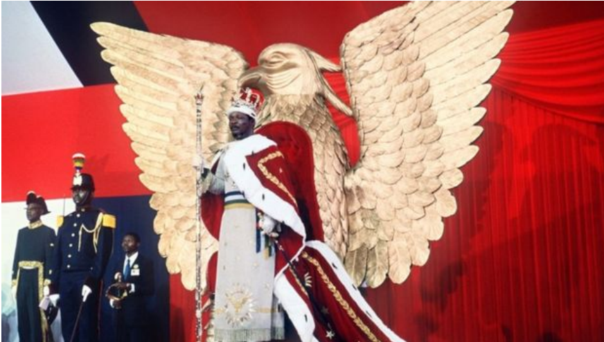
Самокоронацию в 1977 году Бокасса провел по примеру Наполеона Бонапарта.

Вся современная история Центральноафриканской Республики связана с переворотами и попытками Франции и ООН за счет поддержки той или иной стороны установить в государстве порядок.