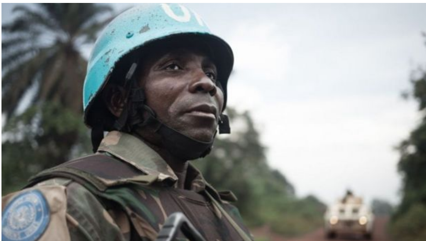
На историю ЦАР не раз влияли международные миротворцы. И сейчас в стране размещен контингент ООН.

В 2013-м Бозизе вынужден был покинуть страну. К тому времени в ЦАР разгорелся вооруженный конфликт между мусульманской группировкой «Селека», и властями страны, а позднее и христианскими вооруженными группировками. Сторонники «Селека» в конце концов захватили столицу страны, город Банги, и отстранили режим Бозизе от власти.