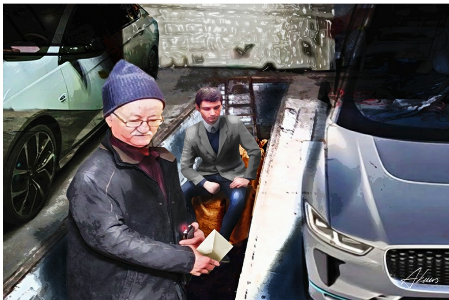
Иллюстрации: Артур Куус