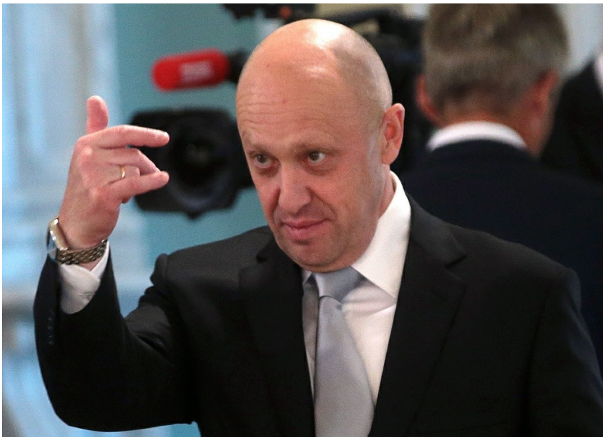
Евгений Пригожин.

— История Сочи разве не похожа на те, что происходят с мафией в Италии?