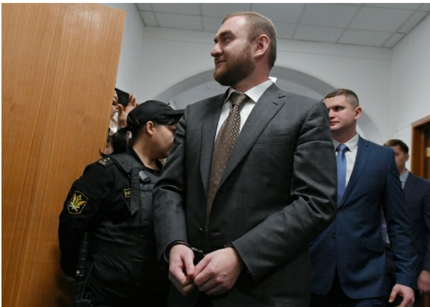
Сенатора от Карачаево-Черкесии Рауфа Арашукова задержали на заседании Совета Федерации.

— Да, это был театр. Политическое решение было принято, но это была демонстрация того, что как бы высоко ты ни забрался, если государство захочет тебя достать, оно достанет.