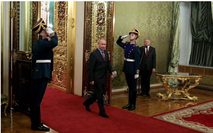
Владимир Путин в Кремле.