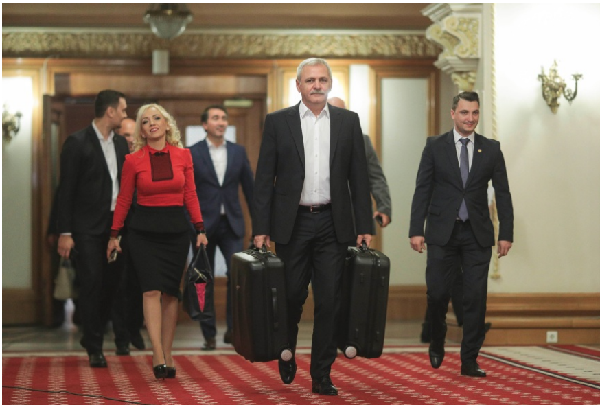
Драгня с чемоданами.

Президент страны Йоганнис до последнего боролся, чтобы сохранить Ковеши в должности, однако большая политсила, которая заручилась поддержкой министерства юстиции Румынии в этом вопросе все же дождала решение об увольнении антикоррупционерки. В конце мая прошлого года большинство судей Конституционного суда Румынии принял решение, обязывающее президента подписать указ об увольнении Ковеши. Тогда румыны вышли на массовые протесты с требованием защитить ее.