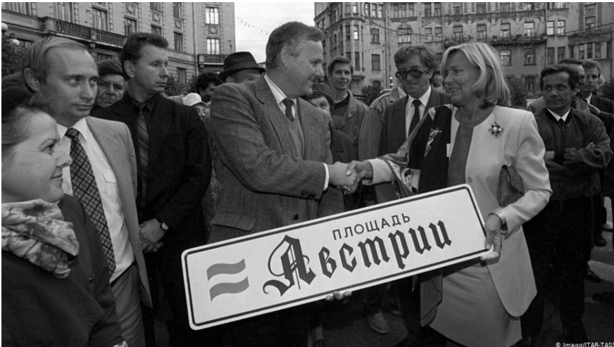
Владимир Путин после увольнения из КГБ был заместителем Анатолия Собчака (фото из архива)