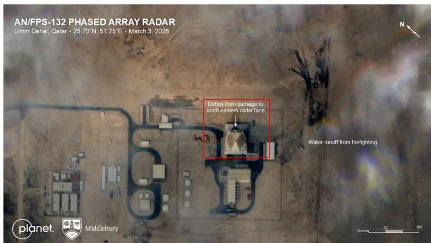
Супутниковий знімок пошкоджень радара AN/FPS-132 у Катарі 3 березня 2026 року.

Зокрема, саме за допомогою «шахідів» вдалося пошкодити або повністю вивести з ладу кілька дорогих американських радіолокаційних систем у районі Перської затоки. Так, дроном було уражено радар раннього попередження AN/FPS-132 на американській базі Аль-Удейд у Катарі, згідно з офіційною заявою влади .