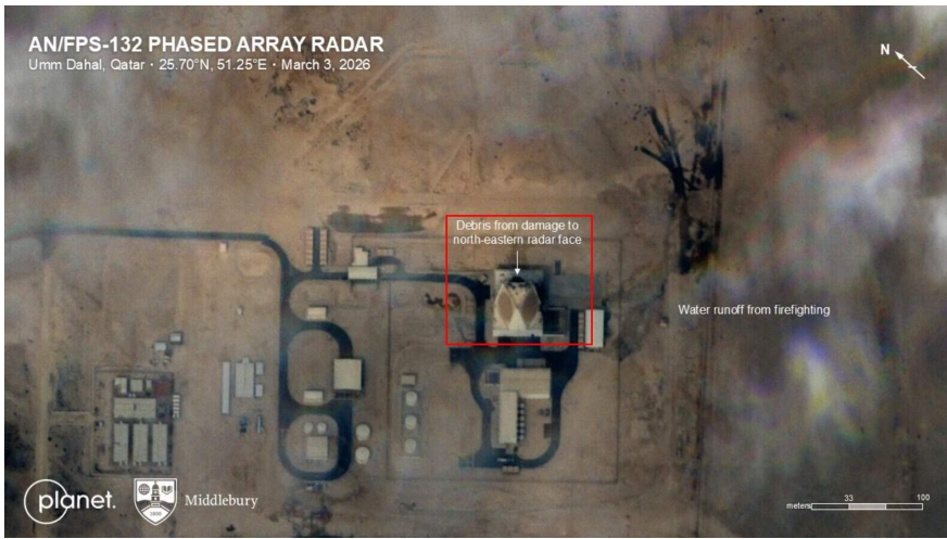
Супутниковий знімок пошкоджень радару AN/FPS-132 у Катарі 3 березня 2026 року.

Найбільш цинічним аспектом цієї угоди є «апгрейд» безпілотників. Росія, яка використала понад 57 000 дронів типу Shahed проти України, навчилася адаптувати їх для протидії засобам радіоелектронної боротьби (РЕБ) та покращила їхню навігацію.