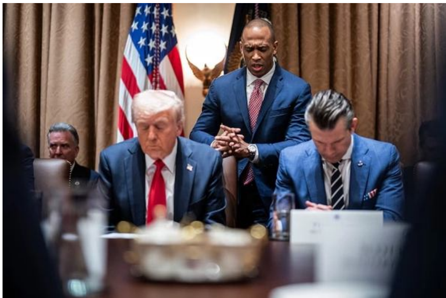
Міністр житлового будівництва та міського розвитку Скотт Тернер молиться, а президент Трамп і Піт Хегсет слухають його під час засідання уряду 26 лютого 2025 року.

Читайте також: Чому стратегічна помилка США у війні з Іраном дорого обійдеться всьому світу