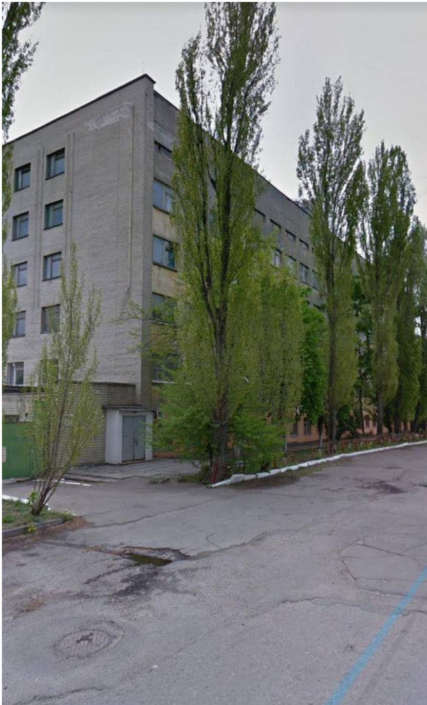
Речь идет об этом здании

Сейчас у меня есть замечательная ситуация на Новопечерских Липках, где находится геодезическое предприятие. При проведении аудита выяснилось, что там оформляются документы под застройку современного жилого комплекса. Само помещение расположено прямо в центре - "Французский квартал". При этом руководитель ГП сдает там офисы в аренду.