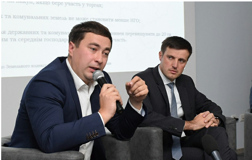
Министр аграрной политики Украины Роман Лещенко (слева), заместитель министра развития экономики, торговли и сельского хозяйства Украины Тарас Высоцкий (справа)