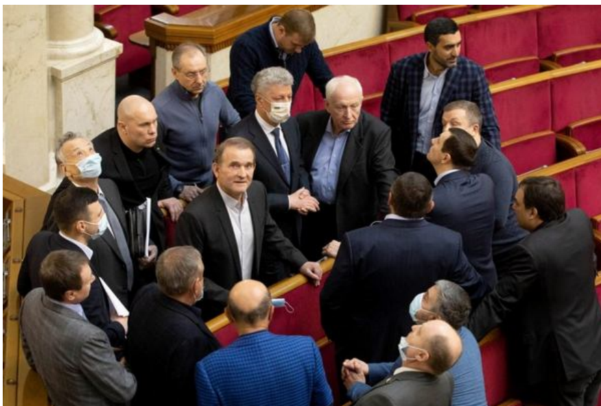
Партія ОПЗЖ в Верховній Раді, яка на сьогодні є забороненою.

Тим часом до Реєстру фізичних осіб під санкціями РНБО внесено вже понад 7 тис. громадян.