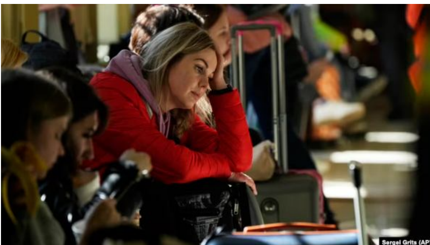
За даними ООН, в Європі зареєстровано майже 6 мільйонів біженців з України.

О.Б.: А щодо українських біженців. Вже триває третій рік війни, і вже довгий час багато українців перебувають в Європі. Чи ви очікуєте, що ці українці повернуться на Батьківщину?