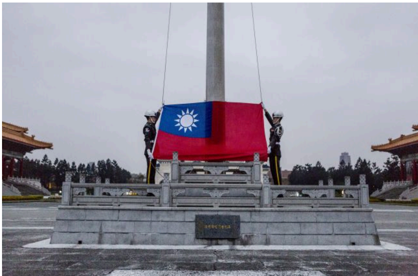
Фото: прапор Тайваню (Getty Images)