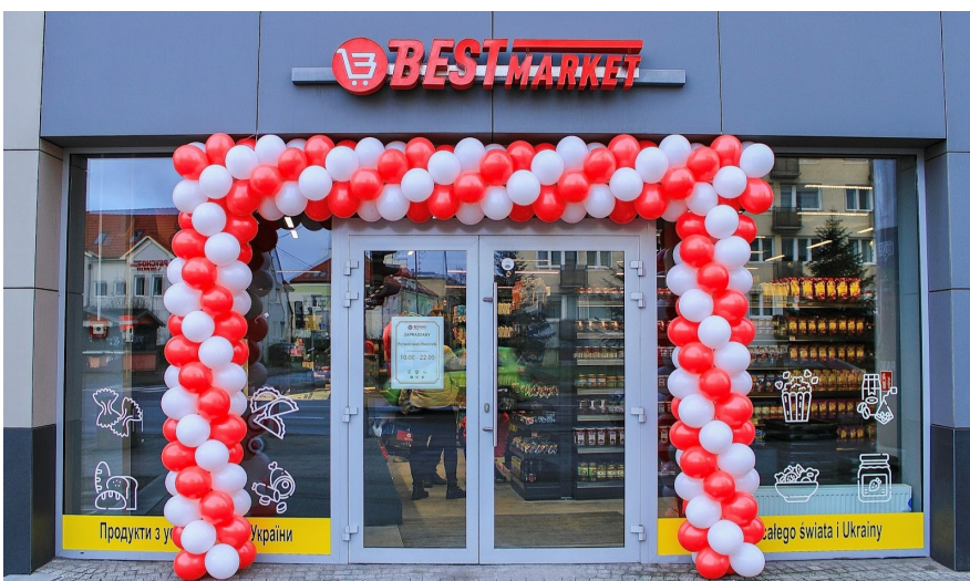
Магазин Best Market у Гданську.

Вони переїхали до Польщі 2016-го, тому що хотіли покращити своє матеріальне становище. Фірму брати заснували 2018 року, а 2019-го відкрили перший магазин у Кракові. До початку повномасштабної війни вони вже мали кілька торгових точок, а сьогодні мережа налічує 16 магазинів у різних польських містах.