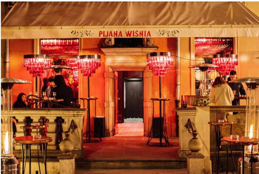
Бар Pijana Wiśnia у Варшаві.

Бренд належить групі !Fest. Вона розпочала свою діяльність 2015 року, а до Польщі прийшла 2019-го. Окрім барів Pijana Wiśnia, вона також володіє рестораном Rebernia в Лодзі . Ця мережа, як і вся група !Fest, була заснована у Львові. В Україні вона має 8 точок, а Лодзь стала першим місцем за кордоном, де відкрився ресторан, що славиться смачними реберцями.