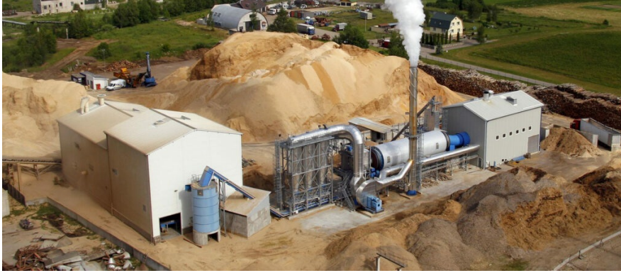
Виробничий майданчик компанії New Fuels RSEZ SI, що спеціалізується на виробництві паливних гранул