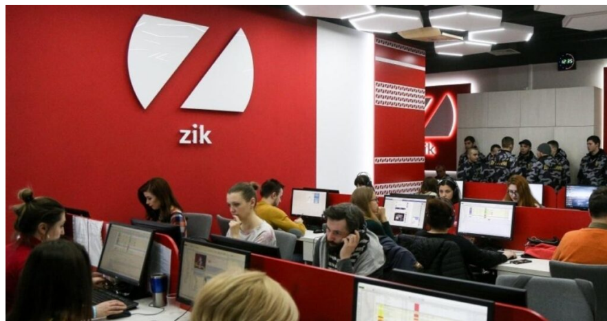
Київський ньюзрум телеканалу ZIK у 2018 році

Реальна вартість продажу телеканалу стала відома з фінансових звітів кіпрської компанії Ablemark Limited, доступ до яких отримали NGL.media. Саме Ablemark володіла українською компанією «Про радіо», а та, своєю чергою «Телерадіокомпанією «Нові комунікації»», якій належали ліцензії на мовлення ZIK.