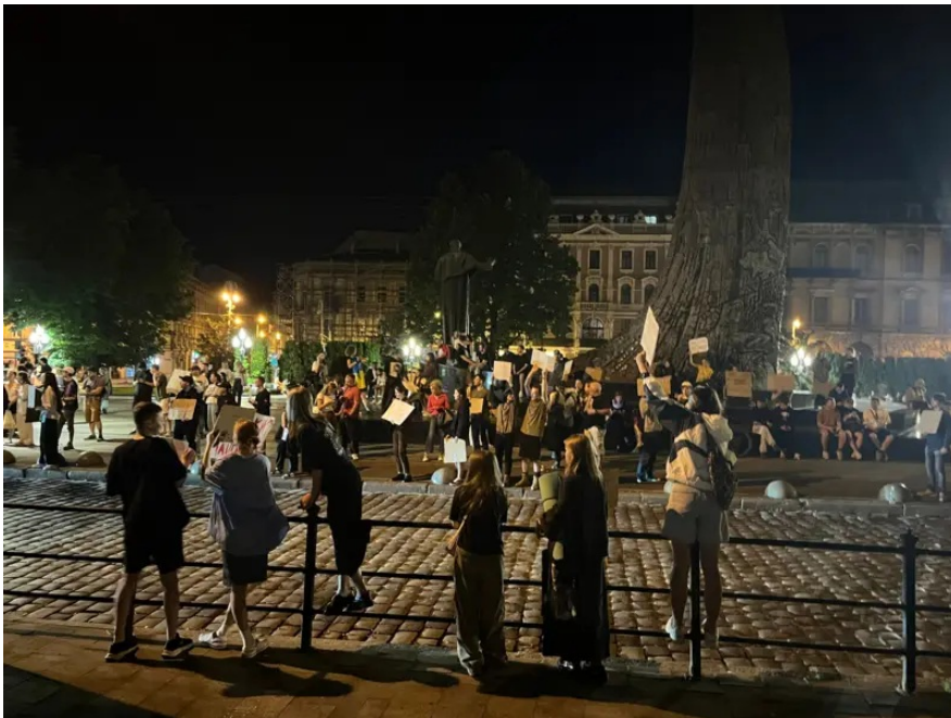
Мітинг у Львові проти знищення НАБУ триває навіть опівночі / ВВС

І ось минуло шість років - і тепер пропрезидентська монобільшість знищує незалежність НАБУ, а команда Порошенка чи не єдина в парламенті стала на захист антикорупційної системи, яку створили десять років тому на вимогу США та ЄС. Проти був і Голос.