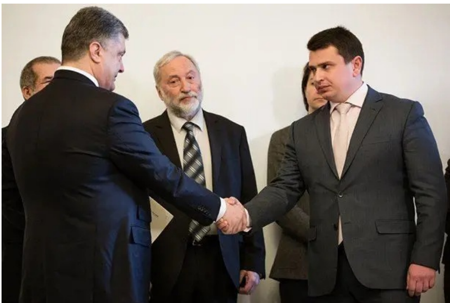
Квітень 2015 року - президент Порошенко призначив першого голову НАБУ, обраного на конкурсі за участі західних експертів. Його стосунки з Артемом Ситником були непрості, але НАБУ встояло

Чому ж НАБУ і САП такі незручні для влади, при чому будь-якої? Відповідь проста: весь задум цих незалежних структур у тому, що вони незалежні.