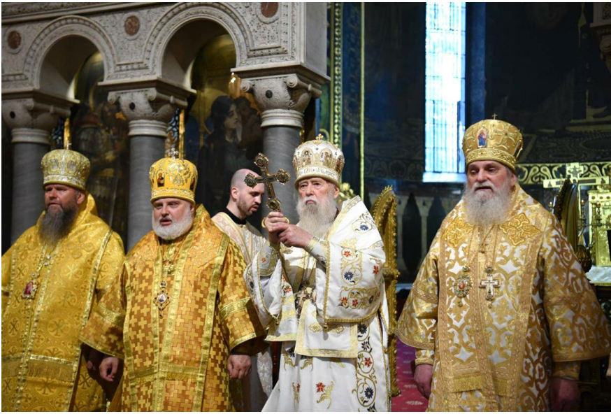
Архієпископ Никодим ліворуч від Філарета під час богослужіння з нагоди Дня Хрещення Руси-України 29 липня 2025 року