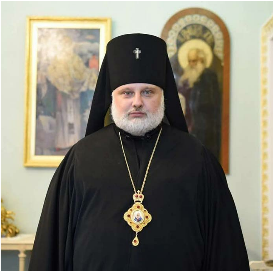
Архієрей Никодим на вернувся у церкву після закінчення військового училища

Мабуть, солідарність офіцерів запасу спрацювала краще, ніж християнська любов.