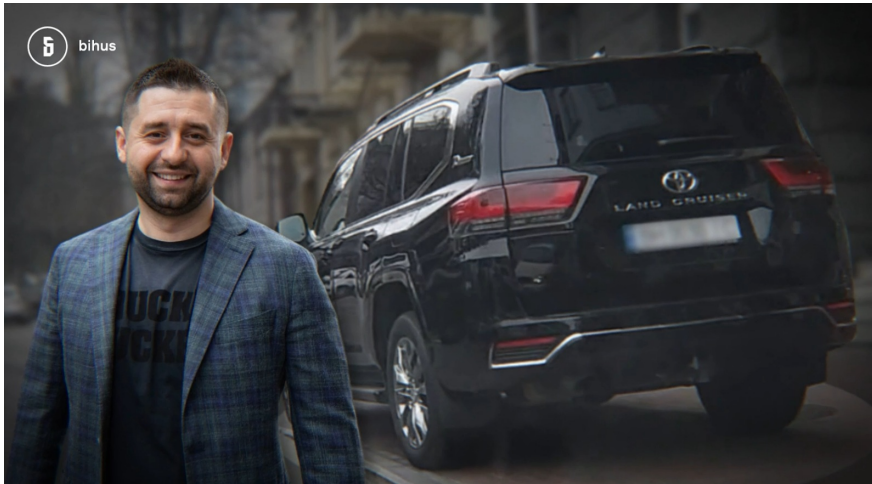
Голова парламентської фракції «Слуга народу» Давид Арахамія

генеральному прокурору заяву про можливе кримінальне правопорушення з боку голови фракції «Слуга народу» Давида Арахамії. В організації його розглядають як потенційного учасника схеми, який начебто відповідав за збір голосів і, з огляду на свою роль, не міг не знати про наявні механізми їхнього «стимулювання».