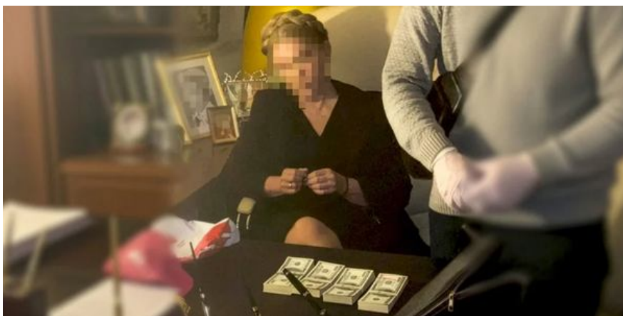
Обшук НАБУ в офісі партії «Батьківщина», 14 січня 2026 р.

Готівка. Окремі блок доказів — готівкові кошти, вилучені під час обшуку НАБУ 13 січня 2026 року в офісі «Батьківщини». Йдеться про суму 46 300 дол. ( 40 тис. дол. у пачках по 10 тис. + 6300 дол. ). З них апеляційний суд скасував арешт на 6300 дол., і НАБУ повернуло ці кошти. Решта суми залишається арештованою, а за Тимошенко внесли заставу у понад 33 млн грн ( близько 770 тис. євро ).