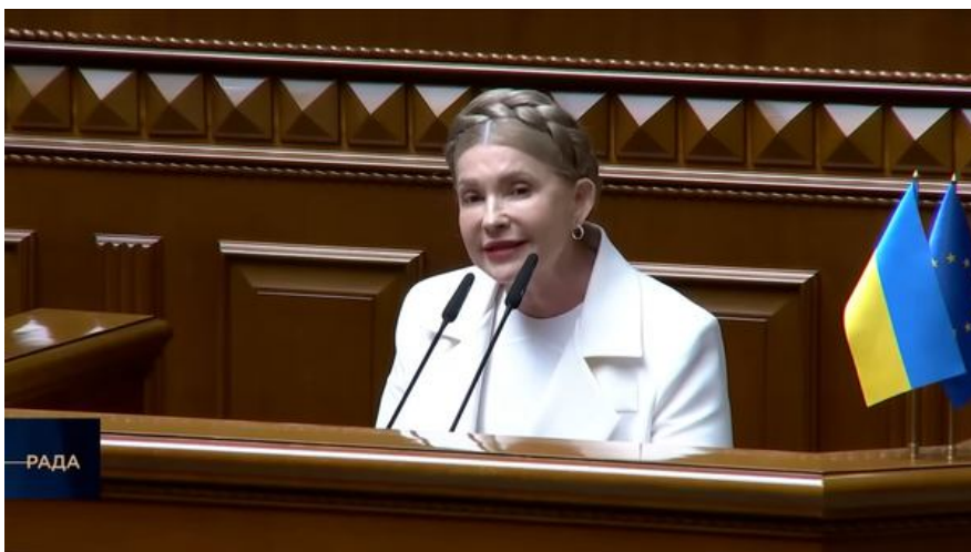
Юлія Тимошенко виступає у Верховній Раді. Скриншот із відео

«НАБУ і САП — це органи політичного впливу на українську владу. І коли треба, корупцію кришують, а коли не треба, проти корупції борються... Скажіть, будь ласка, у 1991 році що, боролися за те, щоб Україна віддала свій суверенітет, незалежність і залишилася країною, якою керують таким, знаєте, ошиїником під струмом?» — говорила Тимошенко про законопроект, який уже повертав суб'єктність НАБУ і САП, чого вимагали українці, які вийшли на так званий картонковий Майдан у липні 2025-го.