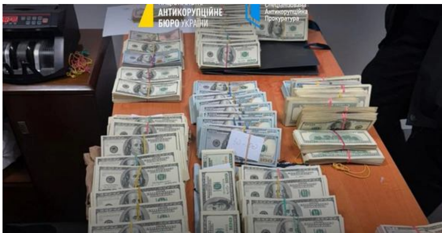
НАБУ проводить обшуки на постах Волинської митниці та КПП «Тиса», січень 2026 р.

структура. Змінити керівника в Києві недостатньо: він має формувати команду по всій вертикалі, на рівні конкретних митниць. Якщо в нього немає інструментів або людей — він нічого не зробить. Тому це завжди поєднання: й системні зміни, й люди, здатні їх реалізувати.