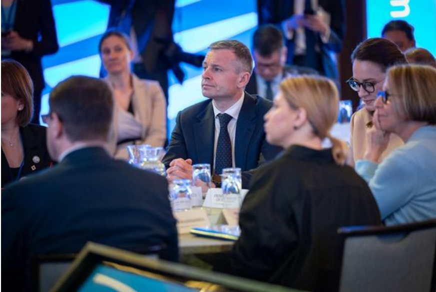
Міністр фінансів України Сергій Марченко та прем'єр-міністр Юлія Свириденко, квітень 2026 р.

перед фактом: або прибираєте всі ці пункти, або документ далі не пройде.