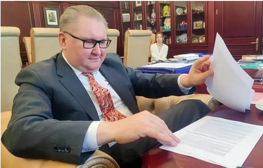
Віце-прем'єр-міністр з питань європейської та євроатлантичної інтеграції України Тарас Качка

Ба більше, на етапі парламенту предметом дискусій можуть стати як ці вже маркерні питання, так й інші — зокрема реформа адвокатури, підходи до регулювання будівельної, енергетичної сфер та оборони держави.