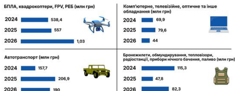
Центр Розвитку Інновацій Придбання БПЛА, квадрокоптерів, FPV-дронів, РЕБ, комп'ютерного та навігаційного обладнання, автотранспорту, бронезилета, тепловізорів. Дані отримані з опитування громад. Деталі на дашборді: https://crlpr.cc/zLW0H