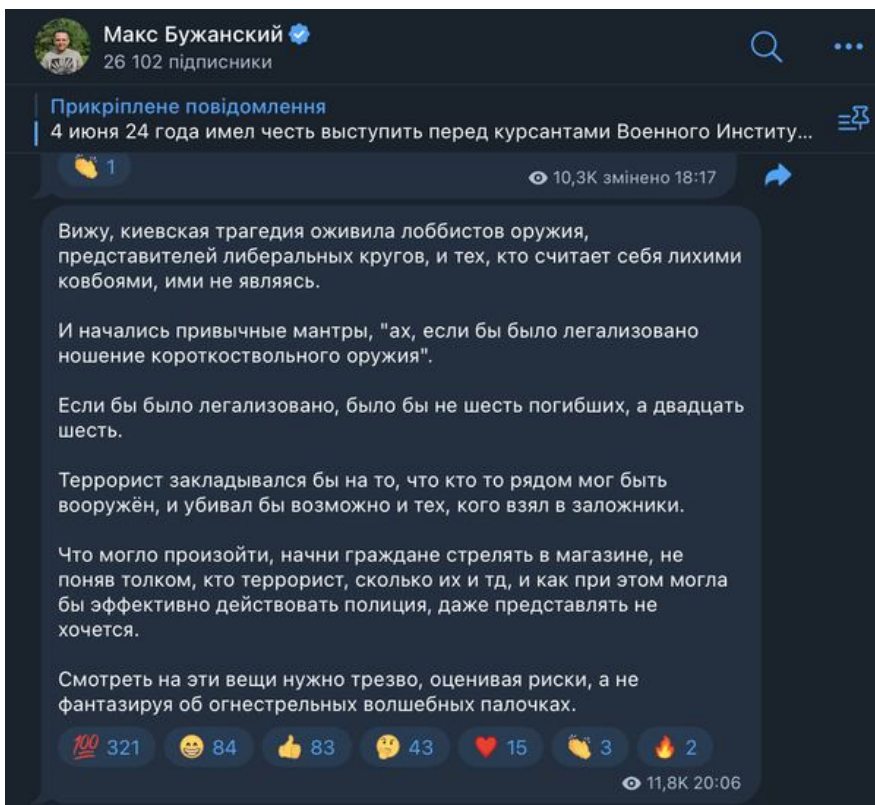
Скриншот допису нардепа Бужанського російською мовою

Схоже, дискусія щодо легалізації носіння короткоствольної зброї в Україні триватиме. Позиції полярні: одні вважають, що це посилить безпеку громадян, інші побоюються можливого зростання насильства та зловживань.