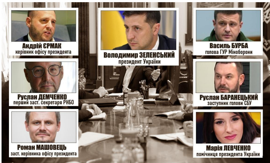
Колаж видання «Новинарня»

На нараді Єрмак категорично наполягав на перенесенні операції, мотивуючи свою позицію тим, що він веде переговори з помічником президента Росії Дмитром Козаком, а затримання «вагнерівців» зашкодить початку перемир'я на Донбасі, запланованого з 27 липня.