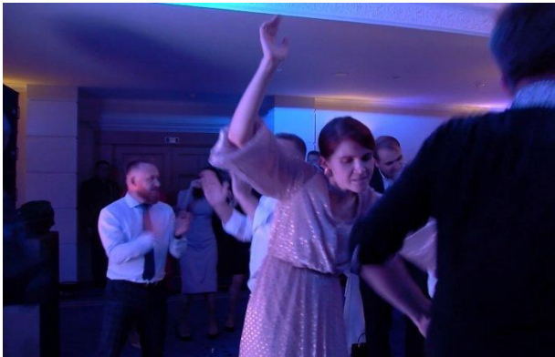
Мар'яна Безугла - «головний слідчий» у справі «вагнерівців»

Щодо виступів, коментарів, заяв Безуглої, то складається враження, що вона марить, коли виступає і сама не розуміє, про що говорить. Не буду давати характеристику її психологічного і психічного стану, хоча маю поглибленні знання у цій сфері в силу своєї професії. Це парафія її колег-медиків. Навчаючись у двох медичних вузах, Безугла повинна була вивчати наукові праці відомого швейцарського психіатра, психоаналітика, психолога Карла Густава Юнга (1875 - 1961) - родоначальника аналітичної психології. Якщо не знайома з його роботами, раджу прочитати, вони доступні в Інтернеті. На загал приведу лише один із висновків вченого: «Ви не можете вберегти деяких людей від вчинення жажливих дурниць, тому що вони у них в крові».