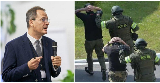
Христо Грозев із Bellingcat і затримання «вагнерівців» в Мінську

Нагадаю, що не встиг Зеленський повернутися в Київ після зустрічі з президентом США Байденом 31 серпня, як 5 вересня на «MezhyhiryaFest-2021» журналіст Грозев в черговий раз повідомив, що незабаром вони випустять «три продукти», присвячені справі «вагнерівців».